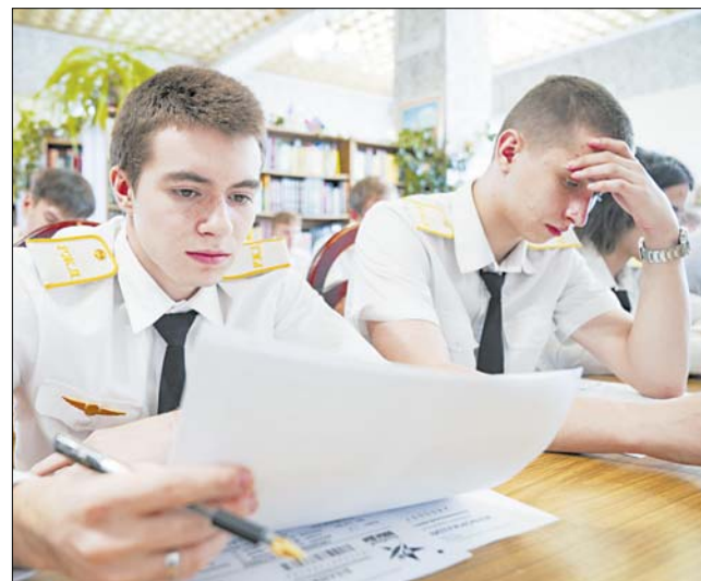
В областной юношеской библиотеке историческое испытание держали студенты железнодорожного колледжа.