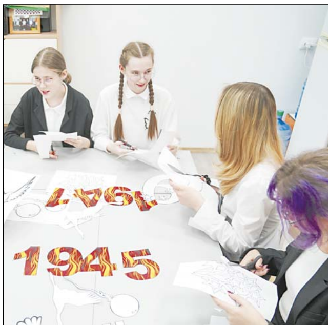
Ученики ивановского лицея № 33 вырезают символы Победы на уроках труда или дома.