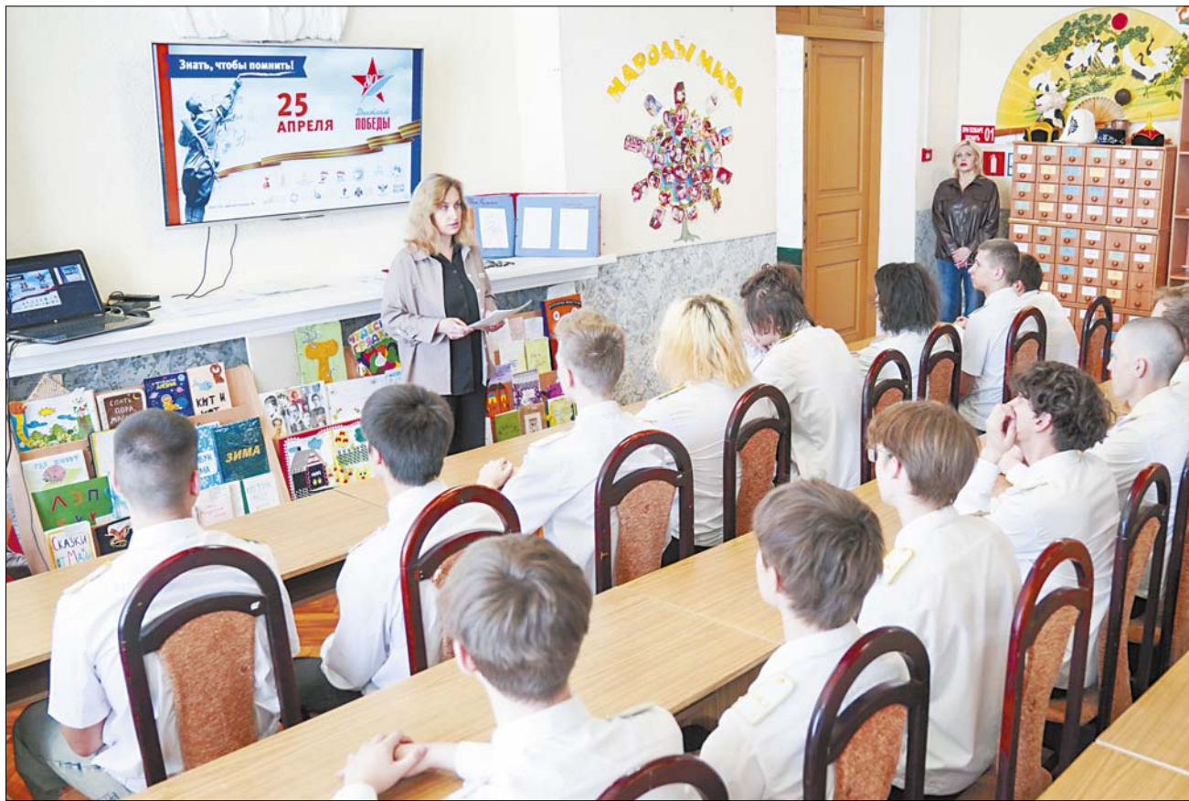
В Ивановской области "Диктант Победы" писали на 143 образовательных площадках.

В преддверии праздника 9 Мая проводятся традиционные акции "Диктант Победы" и "Окна Победы". Они направлены на сохранение исторической памяти о Великой Отечественной войне, выражение благодарности ветеранам и труженикам тыла. За участниками проектов в этом году понаблюдал фотокорреспондент "ИГ" Дмитрий РЫЖАКОВ