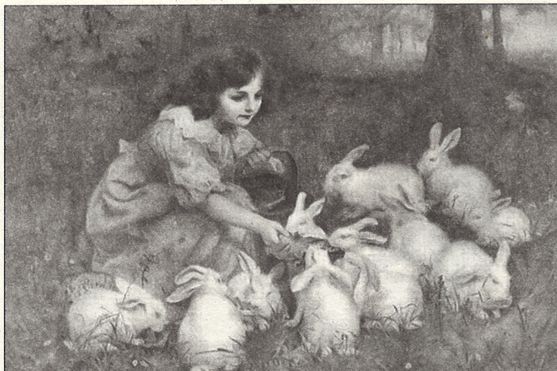
Кормление белых кроликов. Иллюстрация к сказке Л. Кэрролла «Алиса в Стране чудес». Художник Ф. Морган. Около 1904 г.

8. «Как приручить дракона», Крессида Коуэлл.