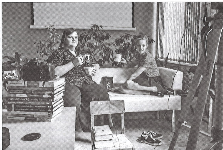
▲ Каждый раз авторы подкаста стараются создать непринуждённую душевную атмосферу. И это им удаётся. Согласитесь, забраться с ногами на диван мы себе позволяем лишь в кругу очень близких людей

Пилотный ролик вышел в декабре 2022 г. и был посвящён повести «Пикник на обочине» Аркадия и Бориса Стругацких. Чтобы эффектно представить новый проект, мы организовали фотосессию в постапокалиптическом стиле. Съёмки проходили за городом, в заброшенной деревне. Для пущей убедительности ведущие надели противогазы. Весь этот антураж привлёк внимание многих людей, а фотографии по-