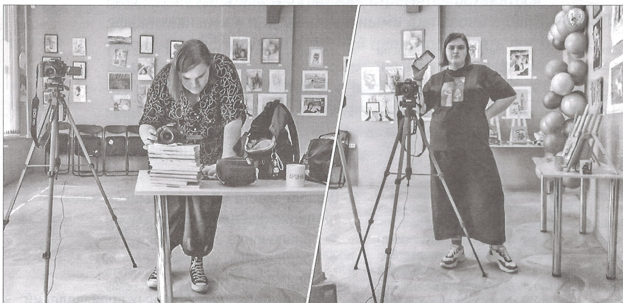
▲ Съёмке каждого ролика предшествует большая подготовительная работа – как в сценарном, так и в техническом плане

Далее авторами было сделано много выводов. Появилось понимание вкусов аудитории. Мы освоили монтаж, усовершенствовали навыки красноречия и перестали бояться камер.