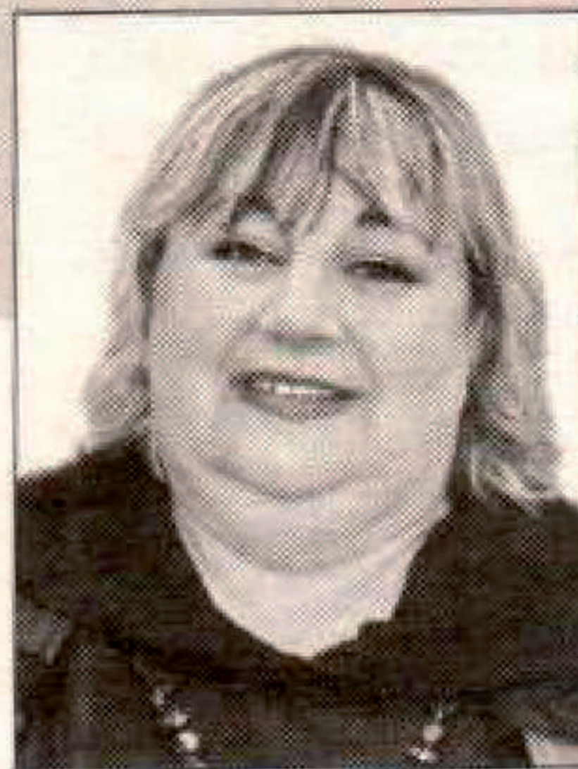
Ивановская областная библиотека для детей и юношества