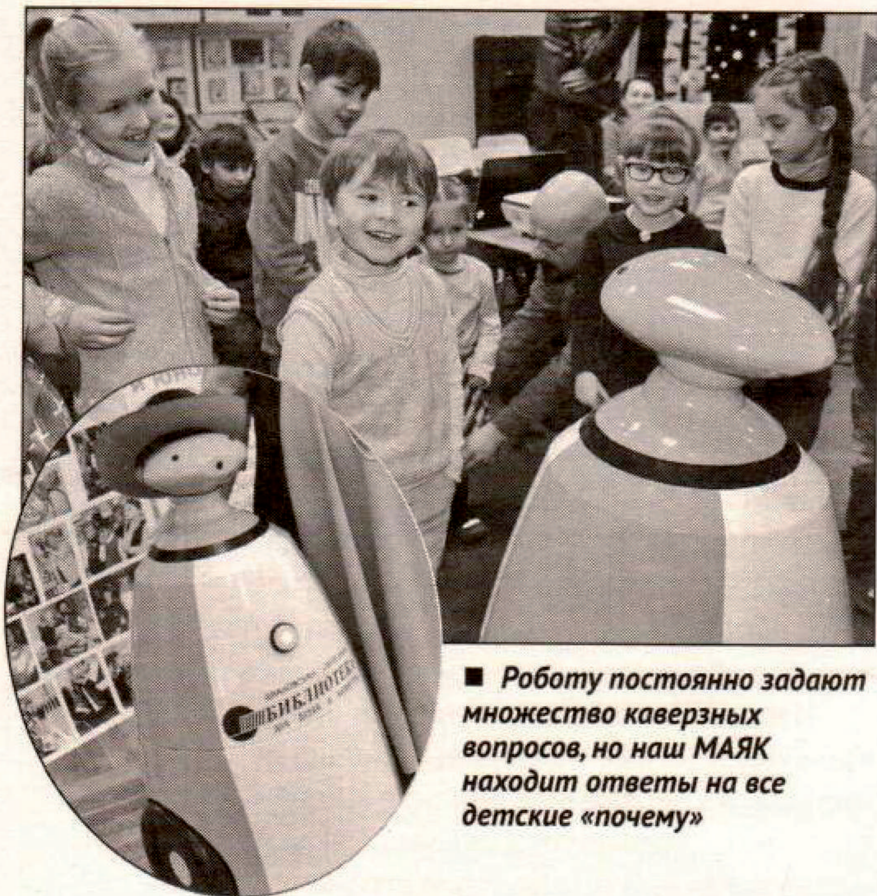
■ Роботу постоянно задают множество каверзных вопросов, но наш МАЯК находит ответы на все детские «почему»

Победы», «Ивановцы — творцы Победы», «Танки Победы», «Самолёты Победы», «Флот Победы» украшены рисунками юных энтузиастов и профессиональных художников. Письма и информационные листы оформлены так, будто присланы с фронта. Читать и перелистывать эту книгу хочется снова и снова. Память о Великой Победе продолжает жить!