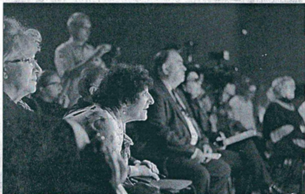
▲ И зрителей, и жюри завораживает происходящее на сцене, хотя там – всего один актер.

Этот фестиваль проходит в регионе второй раз. В прошлом году он был пилотным. «После первого фестиваля профессио-